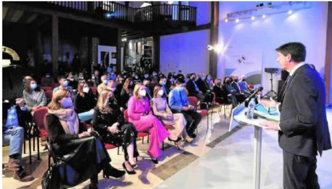
Juan Marín se dirige al auditorio en la inauguración del Foro de 'Turismo de Interior'. ICAJ.