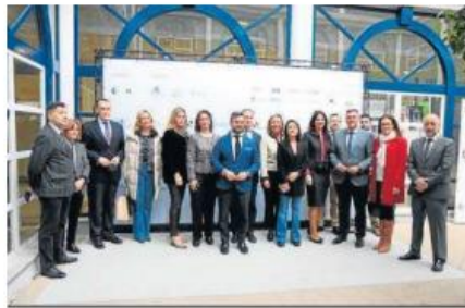
Asistentes a la inauguración del encuentro en Córdoba.

Cardenete subrayó que durante la pandemia la Consejería de Turismo puso a disposición de las empresas del turismo y la hostelería de Córdoba ayudas y subvenciones por un importe de 21 millones de euros, mientras que trabaja en los planes de sostenibilidad en Los Pedroches, la Subbética y la capital, que suman nueve millones de euros de inversión.