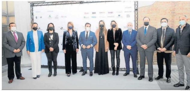
Imagen de las autoridades y representantes institucionales poco antes de la inauguración de las jornadas.

• El viceconsejero de Turismo apuesta por la colaboración transversal a la hora de impulsar una actividad de alto valor añadido y de alto nivel adquisitivo