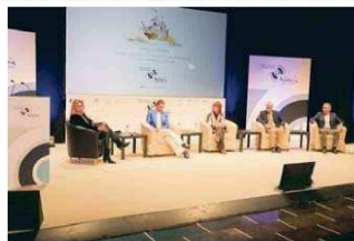
Uno de los debates de los foros. (1)

Cardenete, ha señalado que "desde la Consejería de Transformación Económica, Industria, Conocimiento y Universidades, el sector industrial minero aglutinará en los próximos años en la provincia de Huelva inversiones de alrededor 3.000 millones que generarán más de 23.000 empleos directos e indirectos". Además, ha subrayado que, a través de los foros "se están conociendo iniciativas muy rompedoras que están cambiando y revolucionando la oferta turística".